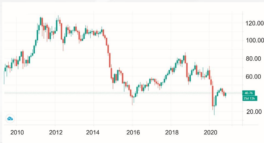
График изменения цены на нефть за последние 10 лет, долл.

Наблюдаемая сегодня концентрация углекислого газа в атмосфере является самой высокой, как минимум, за последние 800 тыс. лет (по другим данным, за последние 3-5 млн. лет).